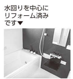
水回りを中心にリフォーム済みです▼

選考方法 応募者多数の場合、子育て世帯（夫婦のいずれかが40歳未満の婚姻世帯または高校生までの子供を扶養している世帯）を優先します。それでも競合する場合は抽選となります。 必要書類 利用申込書様式第4号）、申込者・同居者の住民票の写し、申込者・同居者の所得証明書等、申込者・同居者の納税証明書等、申込みに係る誓約書 ※利用申込書は、企画政策課窓口を設置のほか、ホームページからダウンロードできます。 問・申 企画政策課（☎76-4603）