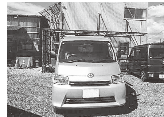
貨物自動車の導入で作業効率を向上