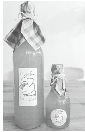
新たに梨ジュース 梨ジャムを開発