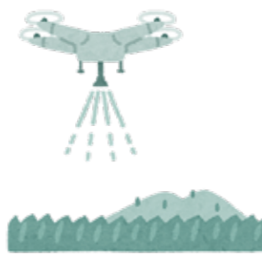
農薬散布ドローン操作