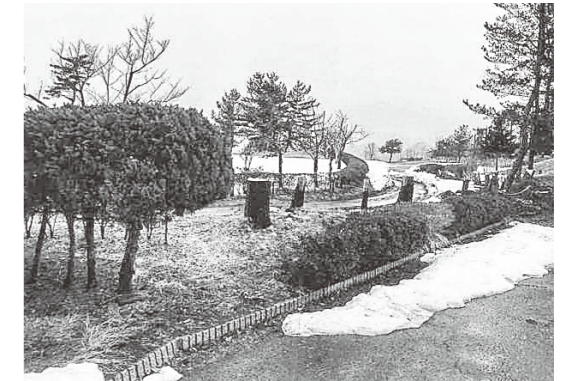
再オープンのために敷地内の樹木を剪定