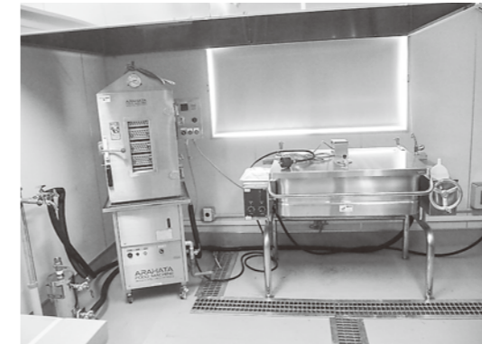
熱調理機器の導入で受注増に対応