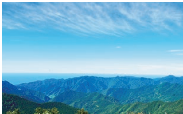
▲ニツ森アクセス道からの眺望

●お問合せ 八森ぶなっこだら TEL0185-77-3086 白神ふれあい館 TEL0185-70-4211