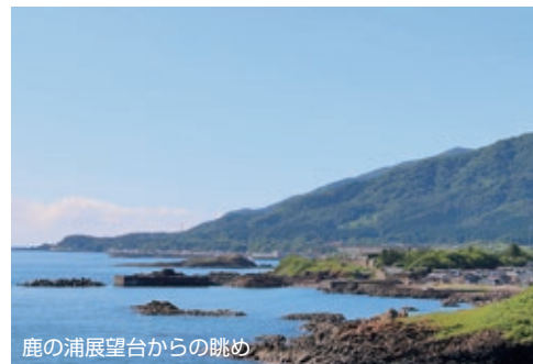
鹿の浦展望台からの眺め

当ジオパークでは、地域の見どころとなる場所を「ジオサイト」として、将来にわたって利用できるよう保全しながら教育や観光に活かし、八峰町の素晴らしい景色を知ってもらう活動を行っています。