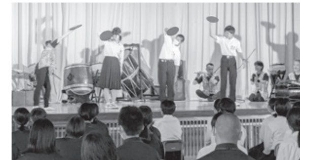
中学生は伝統芸能「盆舞」にも挑戦

7月1日(月)、八峰中学校体育館にて町内の小中学生を対象にした青少年芸術鑑賞事業を行いました。今年度はわらび座による和楽器の演奏を交えた舞台を鑑賞しました。児童・生徒は、迫力ある和楽器演奏や演技を通して、伝統芸能への理解を深めていたようでした。