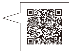
国税庁LINE公式アカウント