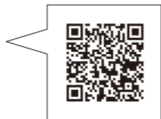
確定申告特集ページ