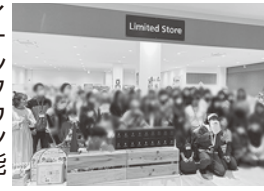
イオンタウン能代で行われたイベントの様子。八峰町産カモミールのPRを行いました。サンタが僕です！