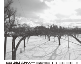
果樹修行頑張ります！