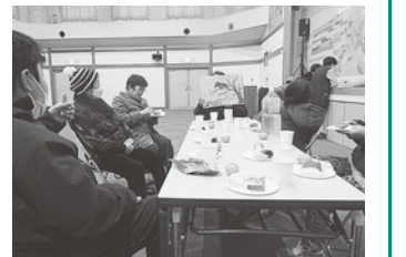
おはなしの会かもめお楽しみ会