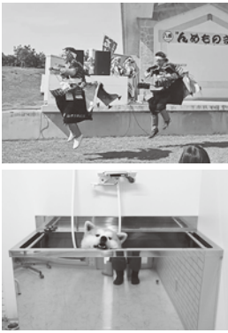
念願の駒踊りデビュー出来ました！

一つ目は僕が大好きな八峰町の特産品「峰浜梨」の栽培です！本当に有難いことに今勉強させていただいております。