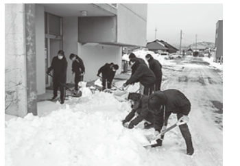
冬の小・中連携 地区奉仕活動