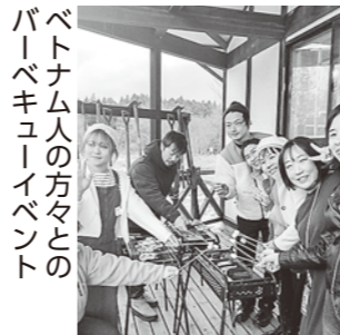
ベトナム人の方々と パーベキューイベント

このような活動を通し、八峰町に 住んでいる方はもちろん、そうでな い方にも八峰町を楽しんでもらいた いという気持ちが強くなりました。 今後はより多くの方が八峰町を楽し める機会を増やしていきたいと思 います。