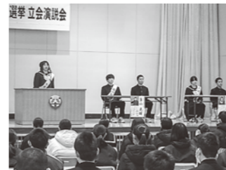
八峰中学校 立会演説会

前号でもお知らせしましたが、コミュニティ・スク ールでは1月19日(金)に、「子どもたちと地域との つながり」をテーマに、熟議を開催します。地域の皆 さんのたくさんのご参加をお待ちしています。