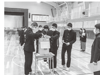
八峰中学校 選挙投票