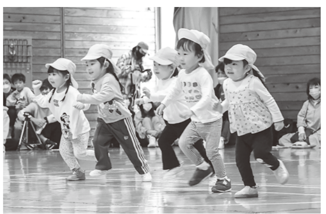
一生懸命走りました

9月30日に峰浜ポンポコ子ども園、10月7日に八森子ども園にて運動会が行われました。両園ともに、園児たちは元気いっぱい各種目に取り組みました。 八森子ども園では、園児の入場行進、元気太鼓から始まりました。親子競技では、親子で楽しく協力して競技をしました。お遊戯では園児の可愛らしい踊りを披露しました。 それぞれのテーマに沿った競技やお遊戯、リレーを行い、お友達や親子一緒にみんなで力を合わせ、笑顔で頑張りました。