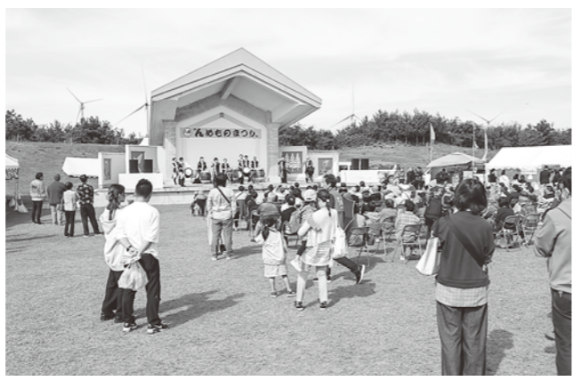
会場を盛り上げたステージ

10月7日、8日にポンポコ山公園にて、八峰町をはじめとした各地のグルメが集まるイベント第16回は「まっぴるめ」の「まっぴるめ」が行われました。 今回はご当地そばフェアと称し、県内外の名物そば6店が集合しました。他にも、東北各地から屋台やキッチンカーの出店のほか、北海道のスイーツ販売なども行われました。 ステージイベントではSTUDIO JAMによるダンスや、超新星ポップスオーケストラによる演奏、峰神太鼓による太鼓演奏などがあり、連日多くの来場者で賑わいました。