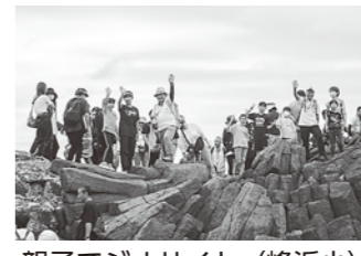
親子でジオサイト (峰浜小) 「柱状節理」

10月に入り、収穫の秋、文化の秋を迎えました。小・中学校では、総合的な学習の時間や学習発表会など、文化的行事が盛りだくさんです。これからも、学校と地域の連携やつながりについて、ブログやコミスク通信を通してお知らせしていきます。