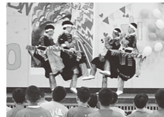
八峰中祭での駒踊り発表

送られました。石川地区の伝統芸能を継承する、地域の大人と子どもたちのつながりを感じることができた発表でした。