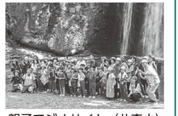
親子でジオサイト (八森小) 「白瀑神社」