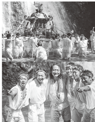
白瀑神社例大祭の様子

協力隊卒業後のやりたいことが少しずつですが、かたまってきました。農家レストランを開きたいと思っています。そこではフリーマーケット、スペースやキッズスペース、カフェスペース、産直スペース、物販スペース等があり、町内外の方々がイベントを気軽に開催するみんなの居場所の様な所を作りたいと思っています。農家としては果樹を本当にやりたいと思っております。知識がゼロなので勉強させていただきます！思っております！ 今まで生きてきて無言実行が良いんだと思っていました。最近語る事の大切さを感じましたので、やりたい事や感じた事を口に出して有言実行でいきたいと思えました！皆様これからもよろしくお願いいたします。