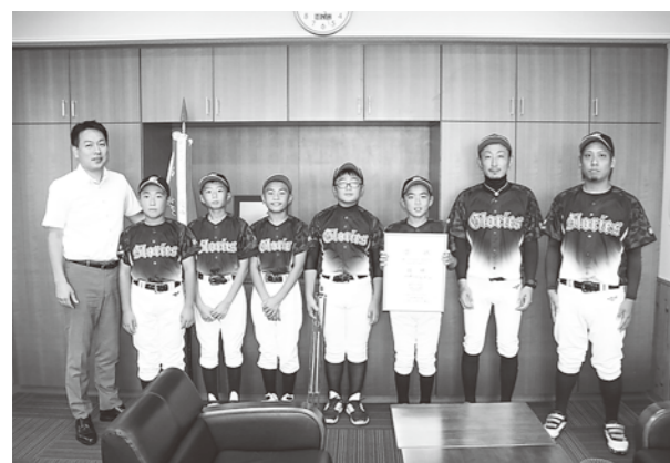
山本郡予選優勝の報告会

9月14日、八峰町役場にて八峰グロリーズの5年生5名が来庁し、第38回学童新人野球山本郡予選大会の優勝の報告会が行われました。 決勝戦は、山本ビクトリーズとの対決となり、試合は、5対0で勝利しました。 チームは、9月16日からの峰浜野球場で行われた第21回東北学童軟式野球秋田県大会に出場しました。 県大会では、1回戦で船越小野球スポーツ少年団に8対6、2回戦で湯沢東野球スポーツ少年団に4対2で勝利しました。準決勝では、角館マックスに2対5と惜敗しましたが、ベスト4という結果を残すことができました。