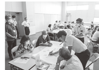
コミュニティ・スクール熟議

9月3日(日)の八峰中祭では、石川郷土芸能保存会の皆様のご協力、生徒有志による奴踊りと駒踊りがステージで発表され、満員の観客の皆さんから、盛大な拍手が