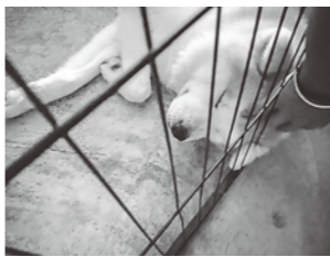
秋田犬のちゃたろう