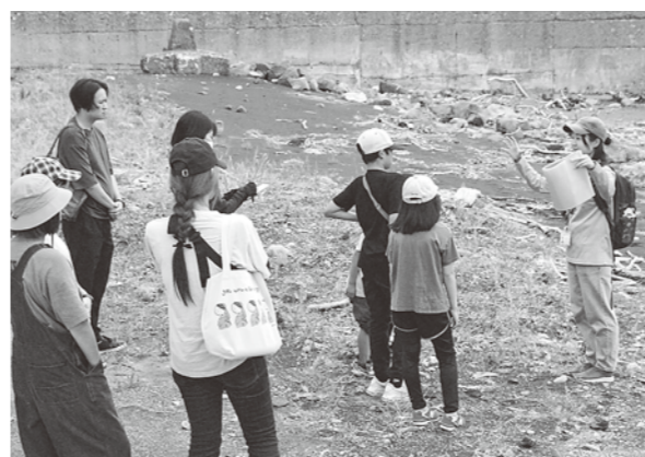
親子でジオについて学びました

9月9日に峰浜小学校、9月10日に八森小学校で八峰白神ジオパークのジオサイトを巡る親子ジオが開催されました。校児童および保護者が参加しました。 ジオサイトとは、科学的に重要な地質・地形やそれに関連する自然・文化・歴史が観察できる場所であり、保全しながら教育やツーリズムに活用するためにジオパークが設定する地域の見どころのことです。 峰浜小学校では、海岸線、留山、三十金の3コースに分かれ、ガイドの案内を受けました。このうち、海岸線では椿漁港で約500万年前に溶岩が固まってできた柱状節理や、中浜海岸で雄島、発盛鉱山の歴史などを学びました。