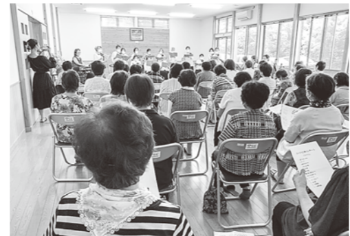
コーラス白練コンサート

令和6年1月31日(水) ※要件を満たす申請であれば、予算の範囲内で交付決定します。