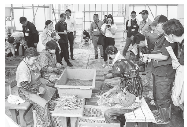
実際の調製作業を視察

9月28日、29日に八峰町にて薬用作物産地支援・栽培技術研修が行われました。県内外の普及・営農指導員や薬用作物の産地育成関係者が参加し、「薬用作物の国内生産拡大の取り組み」や「八峰町における薬用作物生産の取り組み」などの講義が開催されました。 研修初日の現地研修では、町の圃場にて行われ、収穫間近のキキョウの状況など学んだり、実際の調製作業を見学したりしました。薬用作物の特徴や品質評価について今後の支援に必要な知識・技術を学んでいました。