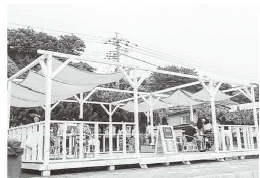
岩館海浜プールでの海の家づくり