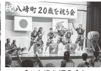
「二十歳を祝う会」 八峰中連太鼓演奏

2学期が始まり、2週間が過ぎました。町内の小・中学校では、9月、10月も大きな行事が目白押しです。今学期も、子どもたちの活動の様子や地域の皆さんとのつながりを、たくさんお伝えしていきます。