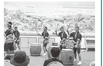
八峰中連太鼓発表会