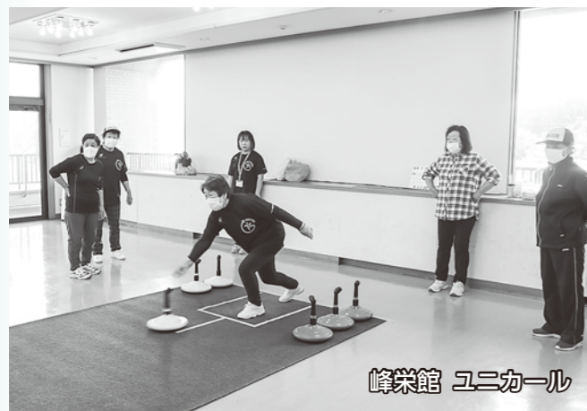
峰栄館 ユニカール