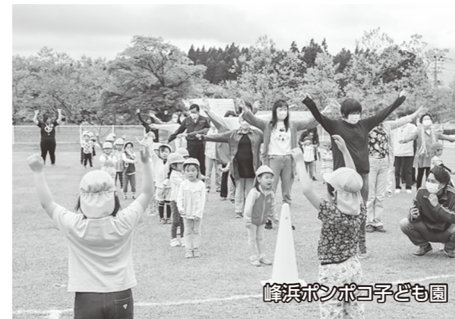
峰浜ボンポコ子ども園