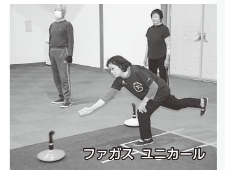
ファガス ユニカール