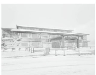
↑先日の大寒波で役場が凍った時の写真です！！真っ白けっけで、見る分にはきれいでしたが、寒かったです！！

秋田の冬は3年ぶりなのですが、先日の大寒波では、水道管が凍結し、凍り止めをしても凍ってしまいう寒さにびっくりしました。毎日の雪かきの大変さも実感しました。それでもやはり秋田が、八峰町が好きです。町の美しい景色と周りの方の温かさのお陰でそう感じる事ができています。この日を送る事ができて感謝の気持ちを大事にしたいなと思います。