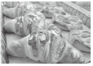
↑大好きな「ポケット」さんのパンです🍞クロワッサン！！あれもこれも美味しくって悩んでしまいます！これからここでは、町内のおいしいお店の紹介をしていきたいと思います♪

町の魅力をたくさんの方に知ってもらいたいので、協力隊4人で何ができるか話し合う時間も増え、楽しいと感じていただけるようなイベント等をできればなと思っています。だんだんと日が長くなって来て、春が近いなあと感じられる空が多く見られるようになり、今から八峰町の桜が楽しみです。おすめのお花見スポットがあれば是非教えてください。 業務で外に出ている時以外は、役場2階の農林振興課にいますので、話しかけてもらえれば嬉しく思います。では皆さん、これからもどうぞよろしくお願いいたします。