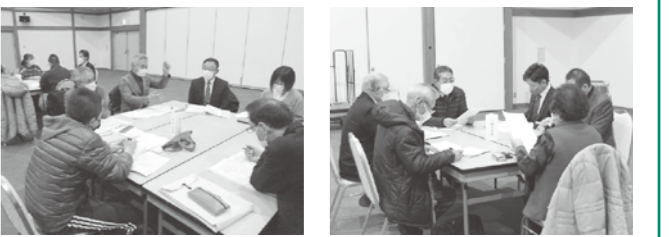
第3回学校運営協議会

委員の皆さんからは、校長先生の自己評価通り、またはそれ以上の高い評価をいただきました。委員の方からは、八森小学校では「ジオパークのふるさと学習が外部から高い評価を得ている。」、峰浜小学校では「11人の6年生が主体的に活動し、見本となる姿を示している。」、八峰中学校では、「生徒一人一人に寄り添い、「居場所づくり」「絆づくり」に取り組んでいる。生徒の様子をフェイスブックで発信している。」など各校の特色ある報告がありました。今回の協議会での意見や提言を、来年度の学校運営に反映させてくださると思います。 小・中学校では、卒業、進級の時期となりました。今年1年間、コミュニティ・スクールの事業推進にご協力くださった地域の皆さん、保護者の皆さん、学校の先生方、学校運営協議会委員の皆さん、そして何よりも、元気に活動する様子を見せてくれた児童・生徒の皆さんに感謝申し上げます。