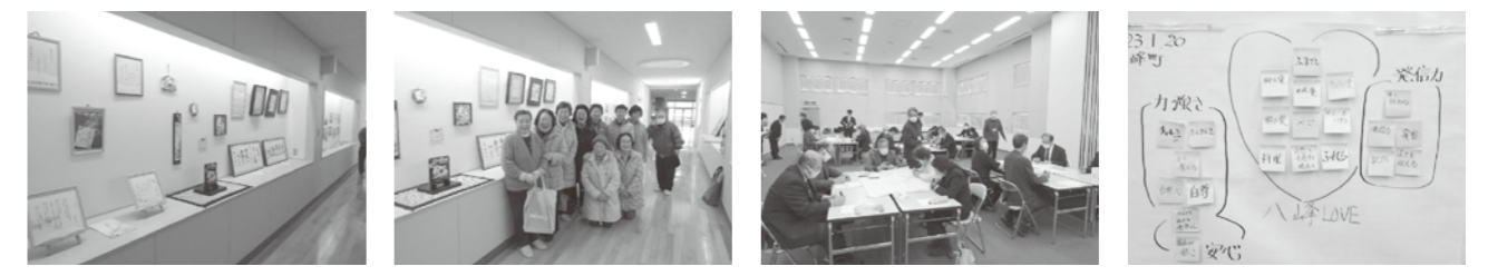
八峰中ギャラリーにオープンした「地域の美術館」 作品を展示して下さった町芸術文化協会の皆さん フォーラム・熟議の様子 熟議の中で心に残ったキーワードを出し合いました

術作品に触れる貴重な機会となります。コミュニティ・スクールに携わる一人として、とてもありがたい取組だと感じています。これを一つのきっかけとして、地域と学校のつながりがさらに強くなればと思います。町民の皆さんも八峰中学校に足を運び、鑑賞してみたいかがでしょうか。 話は変わりますが、1月20日(金)にコミュニティ・スクールのフォーラム・熟議を開催しました。テーマは「八峰町の子どもたちにどのように育ててほしいか」。話し合いには、CS委員の他、各校の先生方、町民の皆さん22名が参加してくださいました。初めから和気あいあいと自分の思いを自由に出し合える雰囲気、明るく活発な意見交換がなされました。熟議の最後に、それぞれが熟議の中で一番に残ったキーワードを出し合うことで、参加した皆さん全員でテーマに対する思いを共有することができたのではと思います。 お忙しい中、参加して下さった皆さん、ありがとうございました。