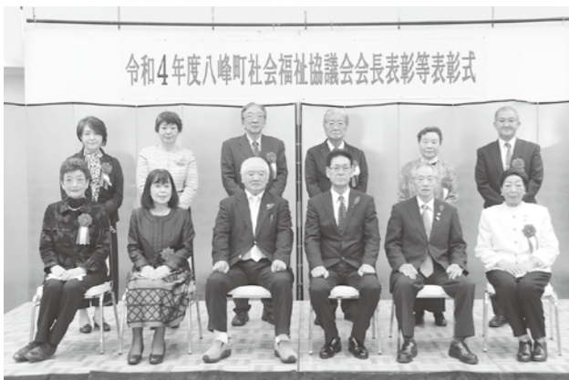
受賞されたみなさんおめでとうございます

11月8日、令和4年度八峰町社会福祉協議会会長表彰等表彰式が峰栄館で行われました。昨年に引き続き、新型コロナウイルス感染症の影響で、例年行われている社会福祉大会が中止となり表彰式の実施となりました。表彰式では、福祉団体、施設等の役員・職員として功績が顕著な方、社会福祉活動を継続して行い、地域社会の模範となる方10名が表彰されました。また、社会福祉のための寄附をされた方1名に感謝状が贈呈されました。これまでの活動に敬意を表するとともに、今後も社会福祉の増進にご協力をお願いします。