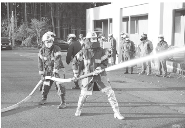
消防団員による放水訓練

11月6日早朝、埴川地区で消防総合訓練が行われ、消防団や八峰消防署などから約60人の参加がありました。この日は、乾燥注意報が継続的に発令される中、埴川健康センターから火災が発生したことを想定した訓練が行われました。午前7時過ぎに、防災無線支局のサイレン吹鳴および緊急放送により火災防ぎ訓練が始まり、中継送水の手順の確認や放水訓練が行われました。併せて警察と交通指導隊による交通整理も実施されました。その後、第5・第8分団の団員は、八峰消防署員から救命救急講習を受け、いざという時のために備えました。