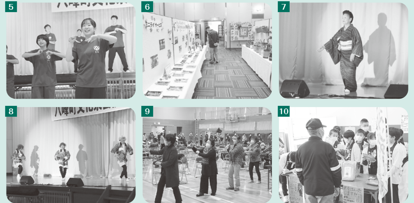
①千葉グループ「秋田大黒舞」②コーラス白神「逢えてよかったね」「ピリブ」③祭鼓連とゆかいな仲間たち「みんなでたごう大太鼓」④大正琴「琴修会」「おもいで酒」「大丈夫」⑤八中生によるパフォーマンス⑥峰栄館の作品展示の様子⑦翔舞会「竜のごとく」「屋島の扇」⑧茂浦民謡同好会「新花笠おどり唄」⑨会場のみんなで盆踊り大会⑩児童・生徒による商品販売の様子

子ども達の力作揃う また、第9回あきた白神子どもの俳画大会表彰式も行われ、子ども達の感受性豊かな作品が披露されました。入賞者は12ページで紹介しています。