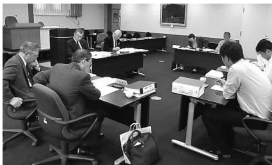
総務民生分科会の様子