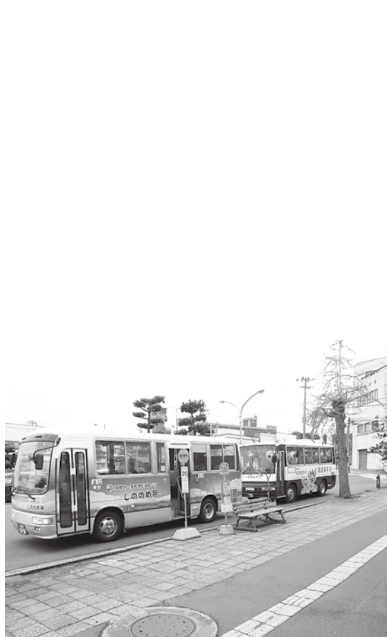
能代市内を循環するはまなす号

町長 農業については、米に依存する農業経営から畑作や施設園芸などの複合経営の促進を支援し、野菜等収益性の高い農産物の生産振興を図るため、様々な事業を展開していきたい。 林業については、これまでも森林組合と連携しながら、植林、下刈り、除伐、間伐、そのための路網整備を計画的に進めてきており、今後も林業者の所得向上に向けて取り組んでいく。 漁業については、漁獲量の確保に向けて、