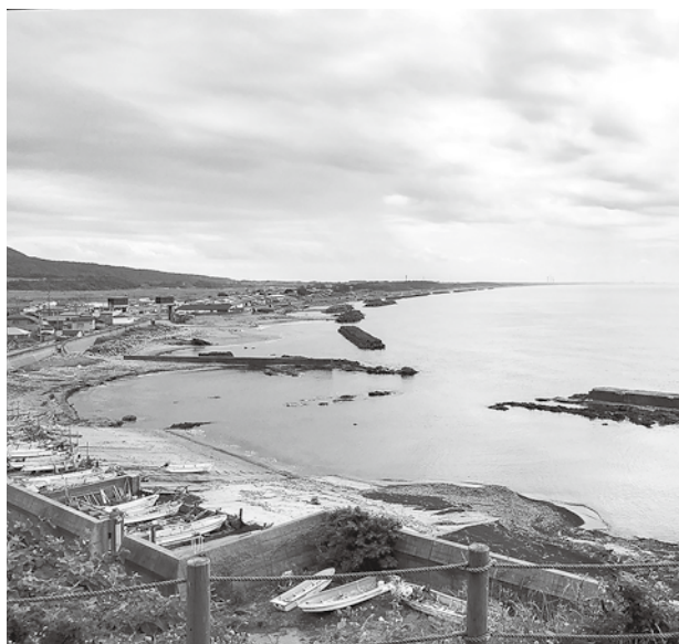
鹿の浦展望台から見た景色

かつ漁業に影響を及ぼさないこと、さらには美しい環境にも配慮した計画であることを前提とし、環境アセスメントを確実に実施し、町民の意見や不安に丁寧な説明と対応して頂くことを基本にし、町の資源である「強い風」を活用していきたい。