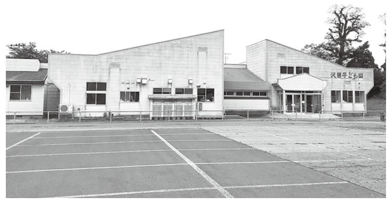
今後利活用が検討される子ども園（写真は沢目子ども園）

町長 他の公共施設への転用、公募等による民間への譲渡・貸付などを含め早急に検討していく。利活用検討委員会は、地域の強い要望があれば考えなければならぬ。