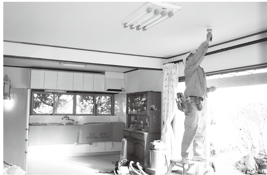
リフォームして新しく生まれ変わる住宅

意見1 職員のメンタルヘルスの推進を 回答 合併前は、職員を2班に分けた研修や、複数名での研修旅行に旅費の一部助成を行ったり福利厚生事業の一つとして実施していたが、参加者の固定化や人数が少ないなどの理由から廃止された経緯がある。 職員が普段から気軽に意見を交わし、気づかうことのできる風通しのよい職場環境となることは、メンタルヘルス対策はもとより、住民サービス向上にもつながる。県内市町村等の状況を確認するとともに職員組合にも意見を求めながら対応を検討する。 また、研修会・講習会の開催についても、年代別・職位別