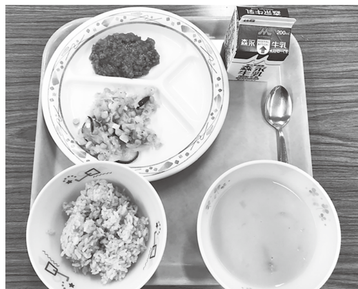
栄養バランスがとれた学校給食