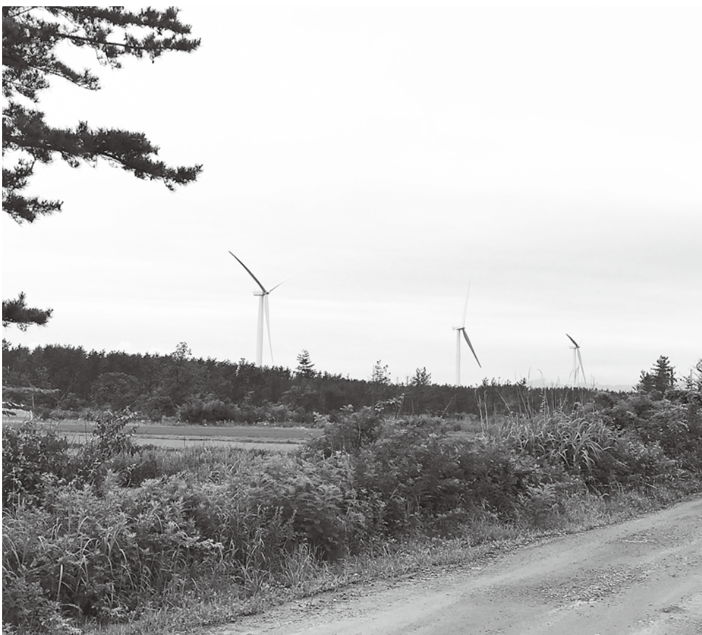
沼田地区に建設中の風車（陸上風力）