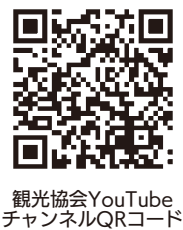
観光協会YouTubeチャンネルQRコード

観光協会が企画・制作したテレビ番組が、令和3年1月31日(日)午後1時15分からABS秋田放送で放送されます。放送後には観光協会のYouTubeチャンネルで配信されますのでぜひご覧ください。