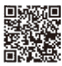
確定申告 特集ページ