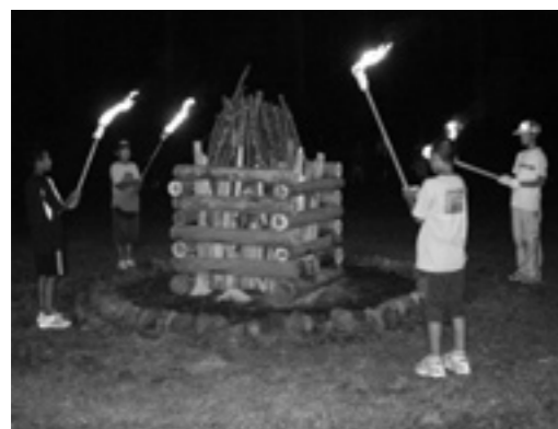
たくさんの仲間達と交流を深めました

夕食後はキャンプファイヤーを行い、団員たちは素晴らしい大自然の中で友情を深め、楽しいひとときを過ごしました。