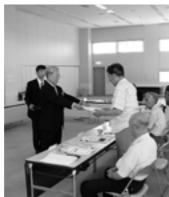
教育長より委嘱状が交付されました

8月25日八峰町文化交流センターで第1回八峰町社会教育中期計画策定委員会が開催されました。社会教育中期計画は、社会教育活動の指針となるもので平成14年度に旧八森町で第4次計画、平成13年度に旧峰浜村で第5次計画が策定されていますが、町村合併に伴い新たな計画の策定が必要になり策定委員会を発足したものです。