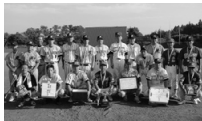
優勝した沼田チーム

決勝は沼田チームと岩館第一・第二連合チームが対決し、終盤に猛攻を見せた沼田チームが圧勝し、初代チャンピオンに輝きました。