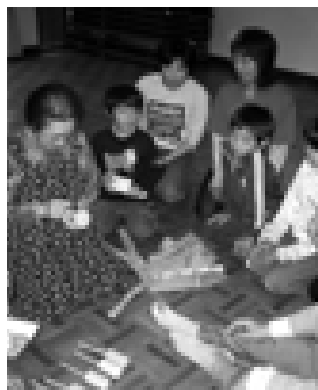
ハタハタクラブ「鹿島人形作り見学」