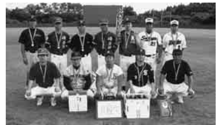
優勝した目名瀧Aチーム

大会初日は朝から猛暑に見舞われましたが、随所に好プレーも見られ、選手たちの若さあふれるプレーに大きな声援が送られました。試合中は相手チームとの交流もはかられ、どの試合も終始和やかに行われました。決勝戦は目名瀧Aチームと八森第一チームが対決。どちらも合併前の大会で優勝経験のある強豪同士の対戦だけあって、両者一步も譲らず、手に汗握る展開となりました。結局