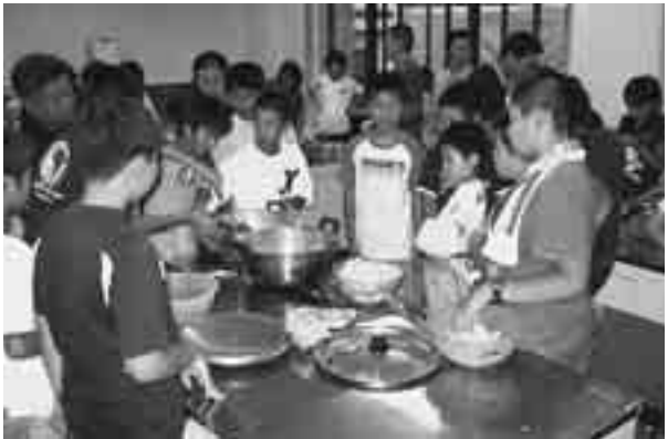
みんなでカレーづくりに挑戦!

町スポーツ少年団のキャンプ大会が8月9日、10日に行われました。当日は雨天により会場を峰栄館に移しての開催となりました。キャンプ大会には6年生の団員47名が参加。峰浜土床体育館でグラウンドゴルフを楽しんだ後、指導者とともに各班に分かれてカレーライス作りに挑戦。何杯もおかわりをするほどおいしく作ることができました。夜にはキャンプファイヤーの代わりに花火を行い、雨の中でも団員たちは元気いっぱい楽しみなが、友情を深めていました。