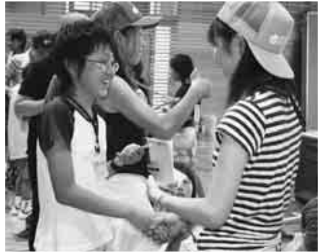
名刺交換で初対面同士が笑顔で握手

第21回参議院議員通常選挙は7月29日、町内11か所の投票所で行われ、即日開票されました。 秋田県選出議員選挙では、無所属で新人の松浦ダイゴ氏が初当選しました。 投票率は73.4%で、前回より0.5ポイント低くなりましたが、今回も高い投票率となりました。 また、期日前投票を利用した人は1392人と前回の1.6倍に増え、投票者総数の25%となりました。