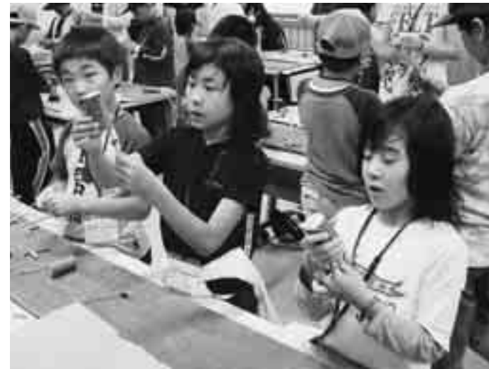
木工アートの作成

8月3日から5日まで、青森・岩手・秋田3県の小学生約120人が、あきた白神体験センターに集まり、自然環境をテーマに交流する「北東北子ども環境サミットinあきた」が開催されました。このサミットは、3県が持ち回りで毎年開催され、今年で9回目です。 今年は自然や環境に関する学習活動を行っているエコクラブのメンバーなどを中心に約120名が参加。ほとんどが初対面で、緊張した面持ちでしたが、自分の名前や特技などを書いたオリジナルの名刺を交換しあいながら、次第に