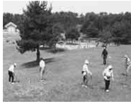
難コースに挑戦しました

6月20日、ボンポコ山グラウンドゴルフ場を会場に第3回八峰町民グラウンドゴルフ大会が開催され、町内愛好者47名による熱戦が繰り広げられました。