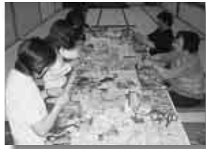
ドライフラワー講座