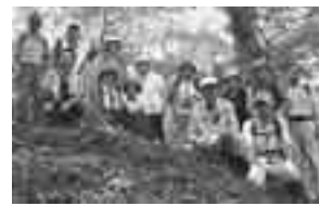
頂上付近での集合写真

天候にも恵まれ、参加者23名全員が、国体で実際に使われるコースを約3時間かけてトレッキングしました。散策の途中では珍しい植物を見ることができ、