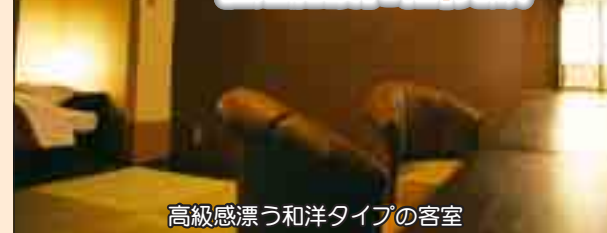
高級感漂う和洋タイプの客室