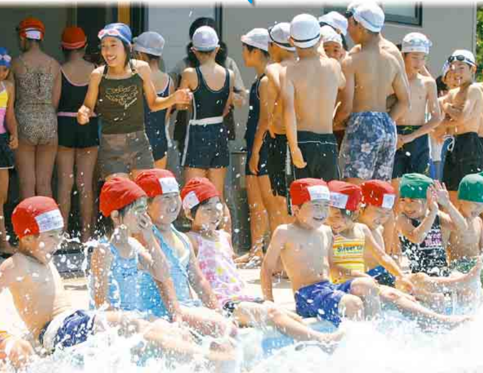
バシャバシャ気持ちいいね！ ～水沢小学校プール開き～