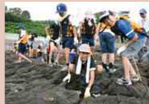
様々な体験活動が行われます。

あきた白神体験センター (0185-77-4455 URL http://www.town.happou.akita.jp/taiken )