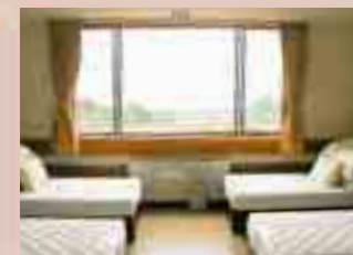
全室オーシャンビュー！