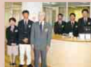
スタッフ一同お待ちしております

八峰町の自然体験活動の拠点に 7月1日、あきた白神体験センターがオープンしました。 八峰町の白神山と日本海という恵まれた自然をいかした体験活動と宿泊研修ができる施設で、秋田県が建設し、町が管理運営を行っている。体験活動には地元NPOや専門的知識をもつ方が講師として協力しており、センター運営の大きな柱となっています。 120名が宿泊可能で、入浴と食事は隣接するハタハタ館を利用します。小中学校の宿泊研修をはじめ、一般の方でも体験活動の計画があれば利用できます。 そのほか、多目的ホールや研修室もあり、シンポジウムや研修等、様々な活動に対応できる施設になっています。