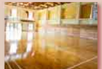
ミニバスもできます