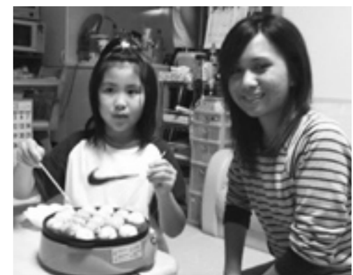
留学生との交流を楽しみました