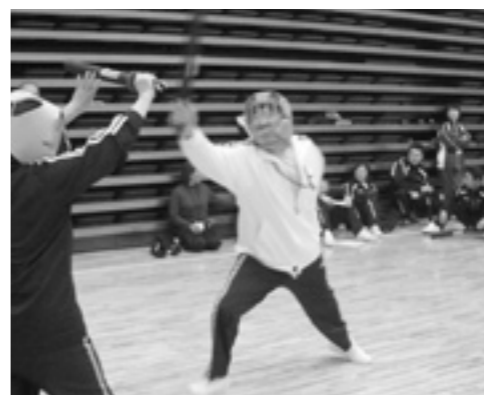
スポーツチャンバラに挑戦

編集 八峰町教育委員会 生涯学習課 山本郡八峰町峰浜田中 字野田沢20-1 TEL 0185-76-2323 FAX 0185-76-2387