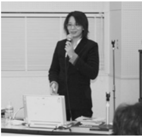
ご自身の経験をご講演くださいました

季節ハタハタ漁 港に活気が溢れる 今年も季節ハタハタ漁のシーズンが到来しました。県内沿岸のハタハタ漁が11月25日に解禁となり、沿岸にはたくさんの網が仕掛けられました。 昨年は解禁日翌日から約270キロが水揚げされましたが、今年は26日にわずか15匹の水揚げ。 12月3日から八森漁港周辺でハタハタ本隊が接岸し漁が本格化してきました。岩館、八森両漁港ではハタハタの箱つめや網はずし作業があとこちで見られました。 やっばり八峰町では、ハタハタがなくては年を越せませんね。