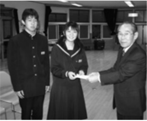
たくさんの善意、ありがとうございます

峰中生よりたくさんの善意 空き瓶等回収の収益金を寄付 12月4日、はつらつ苑において、峰浜中学校で毎年行われている「空き瓶等回収」の収益金が八峰町社会福祉協議会へ寄附されました。 これは、峰浜中学校の生徒たちが、各家庭や地域から夏休み中に集めた「空き瓶」や「空き缶」、また年間を通して回収した「プルタブ」をリサイクル業者に売った収益金です。 社会福祉協議会では、これまで車椅子など介護用品の購入に充ててきましたが、この度は介護予防事業の「いきがいデイサービス」や「いきいきふれあいサロン」で使用するレクリエーションの用具購入に活用する予定です。 峰中生の皆さん、ありがとうございます。