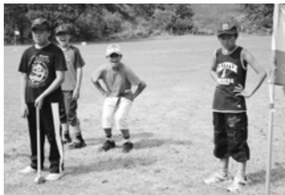
班対抗でのグラウンドゴルフ

・実際の生活拠点のある住所地指定への就学 ※注1…区域外就学については、適用されません。 ■手続き方法 印鑑をお持ちのうえ、教育委員会の学校教育課で手続きをお願いいたします。事由により添付書類が必要な場合がありますので、事前に学校教育課にお問合せください。