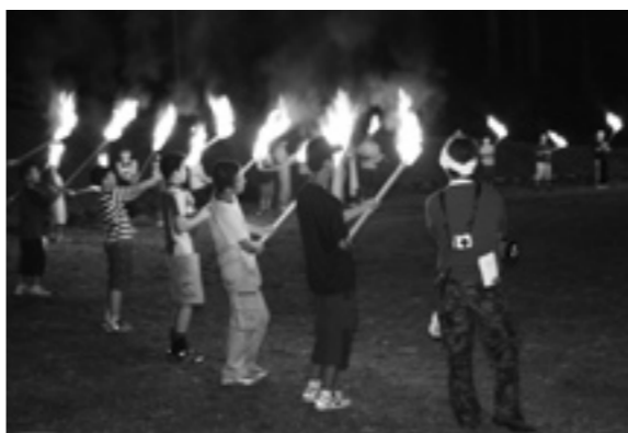
幻想的だったキャンプファイヤー

8月5日、6日町スポーツ少年団のキャンプ大会が藤里町の猿ヶ瀬園地キャンプ場で行われました。野外活動による共同生活の経験を通して、豊かな創造力と活動力を身につけようと毎年行われています。キャンプ大会には町内3スポーツ少年団の団員46名が参加。天候にも