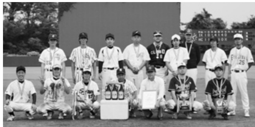
優勝した八森第一チーム

第4回八峰町民野球大会が7月2日と8月2日の2日間にわたり、広域峰浜野球場ほか4会場にて開催されました。八森地区8チーム、峰浜地区16チームの計24チームが参加して熱い戦いが繰り広げられました。出場選手9名の合計が315歳以上とするルールにより、10代から往年の名選手まで幅広い年齢層が参加