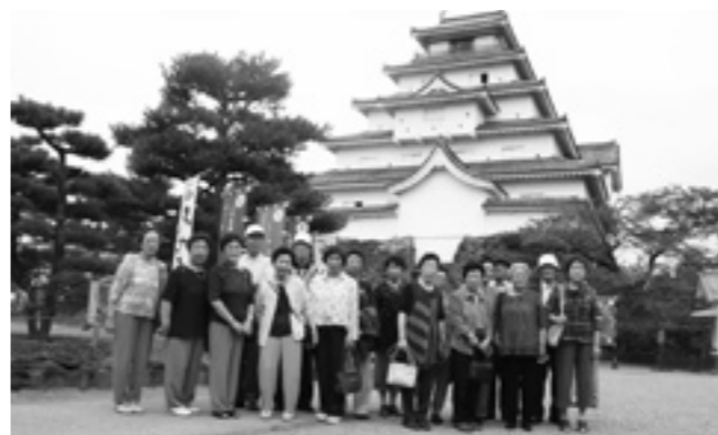
鶴ヶ城をバックに記念撮影

編集 八峰町教育委員会 生涯学習課 山本郡八峰町峰浜田中 字野田沢20-1 TEL 0185-76-2323 FAX 0185-76-2387