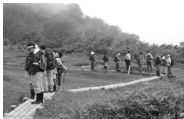
雲がかかった幻想的な湿原を散策

7月12日、真瀬山の会主催の町民登山が開催されました。今年、「信仰と高層湿原の田代岳」と称し、ファガスを午前6時に出発した21人は、山瀬ダムを経由し、荒沢登山口から山頂に向いました。登山道ではブナの巨木とギンリョウソウに迎えられる約2時間30分で立派な社殿がある山頂(1178m)に登頂しました。9合目より上は雲の中にあり、岩木山や眼下の池塘群は望めませんでした。幻想的な湿原を散策することができました。