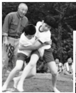
毎年恒例となった 大相撲観海場所