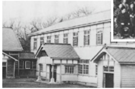
観海小学校の旧校