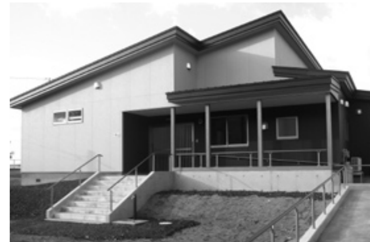
(右上写真) 立石地区公園に建設した立石地区コミュニティセンター。

また、この施設は財団法人自治総合センターのコミュニティ助成事業(宝くじ助成)を活用したものです。