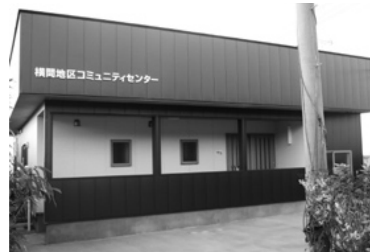
(右下写真) 旧横間児童館跡地に建設した横間地区コミュニティセンター。横間漁港が一望できます。