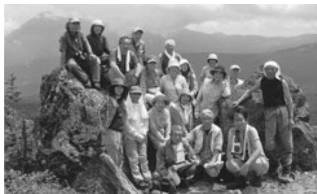
茶臼岳山頂からの絶景

7月18日、真瀬山の会主催の町民登山が開催されました。今年度は「八幡平の高山植物をたずねて」と題し、ファガスを6時に出発した一行21人は、バスにより一路八幡平頂上駐車場を目指しました。ここから、八幡平を経由し、高層湿原に咲くニッコウキスゲやワタスゲに迎えられる約4時間の山歩きを行いました。八幡平の3大展望地である茶臼岳山頂（1578m）からは、岩手山や大深岳、諸樽岳、畚岳などの裏岩手の山々を展望することができました。