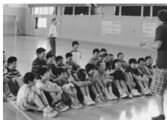
楽しみながら英語にふれました