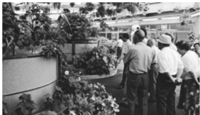
たくさんのペゴニアに見入っていました

大島外周を遊覧船で見学。湾内にはホタテの養殖が多く見られたほか、定置網漁も盛んに行われていて、定置網の近くには円形の生簀が数基設置されていました。これは定置網から生きたまま生簀に移し成長や時期を待つとの事でした。