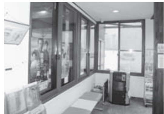
施設内の2重サッシ化