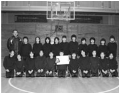
ミニバスの部優勝の水沢マジック・エンジェルズ

好試合・好プレーを披露 全町バスケットボール大会 1月22日・23日の2日間、町バスケットボール協会が主催する全町バスケットボール大会が八森中学校体育館で行われました。 大会には、小・中学生男女、一般などの27チームが参加し、白熱した好ゲームが展開されました。 なお、大会結果は次のとおりです。 ● 一般の部 1部 優勝 あーる24 2部 優勝 Crazydog ● ミニバスの部 女子 優勝 水沢小 6年女子・男子 優勝 八森小6年女子 ● 中学生の部 男子 優勝 東雲中学校 女子 優勝 能代二中