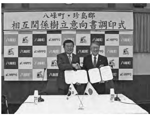
意向書に調印し、がっちりと握手

10月12日、役場において大韓民国全羅南道珍島郡と町による「相互関係樹立意向書」の調印式を行いました。 珍土郡は、漁業と観光を主としており、養殖アワビの生産量は韓国全体の8割を占めているそうです。町では今年から陸上アワビの養殖に取り組み日本白神水産株式会社が事業をスタートさせており、同社と珍土郡との技術交流がきっかけでこのたのびの関係樹立となりました。 今後は、信頼と友好交流を基に協力関係を維持し、経済協力やアワビ養殖事業の発展など、貿易・観光を中心とした様々な事業の推進と発展に協力することとしております。