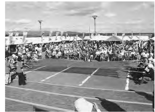
熱戦が繰り広げられた国盗り浴び引き合戦

10月6・7日の2日間にわたり、毎年恒例の「はっぼう「んめものまつり」が道の駅みねはまで開催されました。 今年もわが八峰町をはじめ、県内外のご当地グルメの屋台が出店したほか、盛岡さん踊りやねぶた囃子、仙台すずめ踊りなどが披露されました。 また、全日戦制で行われる「観光的県境」を懸けた国盗りあみ引き合戦は2勝3敗と惜敗。通算成績で3勝5敗となり、残り一戦も落とせない状況となりました。(同月20・21日の津軽深浦チャンチャンまつりでの惜敗のため、観光的県境はこれまでのウエスパ椿山からJR十二湖駅まで南下)