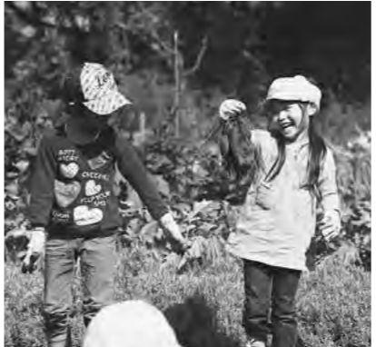
いっぱいとれたよ

10月9・10日、町内子ども園児たちによるサツマイモ掘りが行われ、園児たちは収穫の秋を体験しました。 この収穫体験は、6月に自分たちが植えた苗のサツマイモで、園児たちはこの日が来るのを待ちわびていました。 畝の間にしゃがみ込み、サツマイモを指して土を掘り始めると「あったー!」「大きい!」と畑は大騒ぎ。なかにはツルに連なった「大物」を引き抜いて「やったー」と喜ぶ姿も見られました。今年は例年よりたくさんとれて、みんな大満足のようでした。