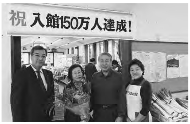
オープンから14年で150万人達成

10月19日、八峰、能代、藤里の3市町を繋ぐ森林基幹道「米代線」(愛称「米代フォレストライン」)が、全線開通し、同線の起点である石川地内でテープカットが行われました。 この米代線は、平成5年から着工し20年かけて完成。延長29・8km、幅員7mで、総事業費は約171億円。石川地区を起点として能代市常盤、同市二ツ井を経由し、藤里町藤琴湯の沢地区までを結んでおり、林業の生産性向上や生活環境の整備、災害など緊急時の迂回路としての機能を持つ道路として整備されました。