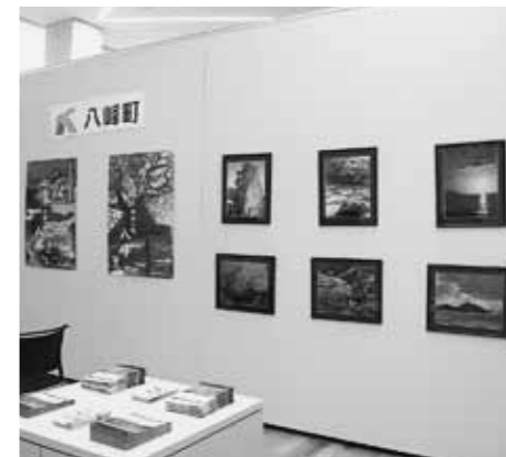
町内の美しい写真が展示されました

9月7日から17日までの11日間、新県立美術館で町内の自然と文化を写した写真展を開催しました。 これは、9月に暫定オープンした新県立美術館の企画展示、「市町村美の競演」と題して行われたもので、八峰町写真クラブの協力を受けて開催しました。 町の展示コーナーには町内の自然や祭、ハタハタ漁などを写した作品が展示され、多くの入館者が立ち寄っていました。