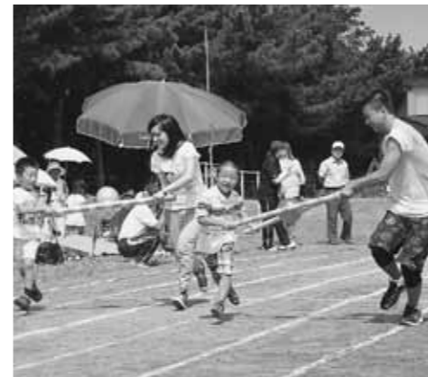
留学生と園児が楽しく交流

9月8日、国際教養大学の留学生ら11名が、八森子ども園の運動会に参加しました。 9月とは思えない暑さの中、園児と留学生が運動会を通じて楽しく交流することができました。 中には英語を使って話しかける園児もいて、留学生も驚いていました。 運動会の最後には留学生2名が代表して「暑かったけど子どもたちがかわいく、とても楽しかった」と日本語で感想を話してくれました。