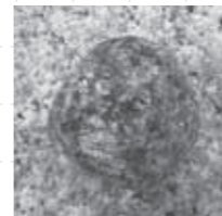
かこう岩にそっくりなおにぎり(写真上)とおにぎりにそっくりなかこう岩(写真下)