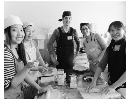
外国のランチづくりに挑戦

※H24年度、図書室に町民の方々から約830冊の本を寄贈して頂きました。受入装備の準備ができ次第、図書室にて貸出しをしております。寄贈してくださったみなさん、ありがとうございました。