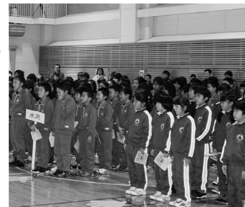
決意を新たに入団式を開催

3月9日、峰栄館で「外国のランチを楽しもう」をテーマに、国際交流事業が行われ、国際教養大学の留学生12名と町民12名の総勢24名で実施されました。この日は、留学生が普段自分の国で食べている5種類の料理を参加者みんなで作りしました。完成した料理は、どれも好評で、あつという間に完食しました。午後からは、峰神太鼓を留学生と一緒に演奏し交流することができました。