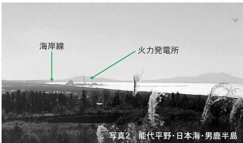
写真2 能代平野・日本海・男鹿半島

その時代にタイムスリップできたところと能代湾とも呼びたくなる様子だったでしょう。