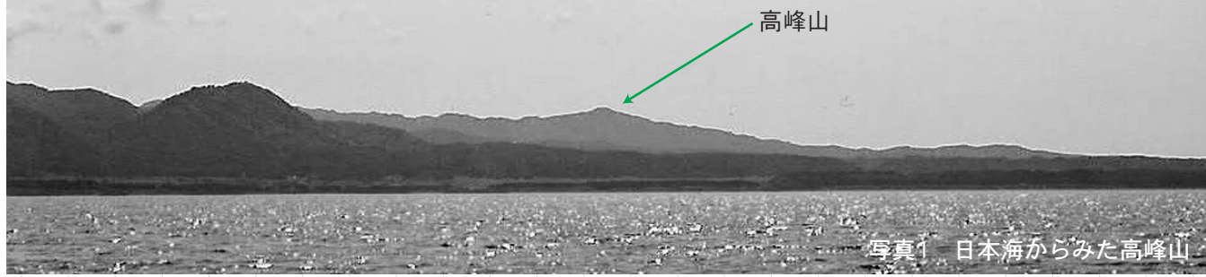
写真1 日本海からみた高峰山

山頂近くにある展望地から眺める風景は美しく、眺める人々の心をふくやかにしてくれまます。 日本海に突き出た男鹿半島、その手に形成された内湾状の海岸線（写真2矢印）、その最も奥まった場所に能代火力発電所がみられます。さらに内陸部は能代平野が形作られています。今から12万6千年前は海でした。もし、