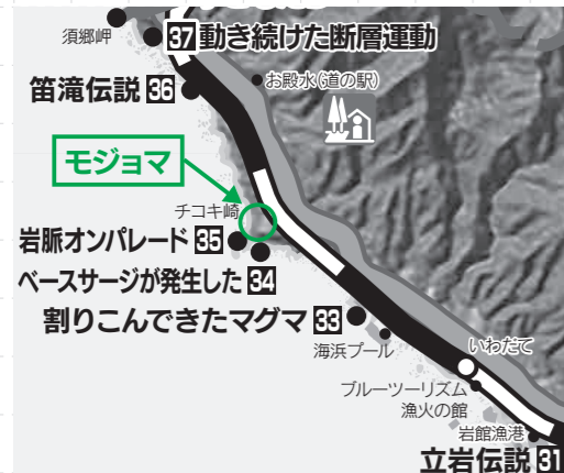
図1 モジョマの位置

この話は昭和の初期頃のできごとでした。ある晴れた夏の頃、一人の漁師が朝早くこの最良の漁場で漁を始めました。その日は大漁であつたらしく、晩、暗くなるまで漁をしていらしたのでした。 普段は漁が終わるとモジョマに入り、ここで魚介類を水揚げし、それらを背負って現在灯台のある場所まで運び上げていました。その日は大漁だったことと、あたりが暗くなったことなどを考え、チゴキ崎の先端を廻り崎の南側の砂場に陸上しようとしたら、沖の沖に出ってしまったらしいのです(写真2)。夏の晴れた日は海陸風が起ることは知っていたはずなのに、魔がさしたという事ではなかったか。その時間帯は陸風(陸軟風)が強かったはずなのです。 それからというもの、夜になると沖