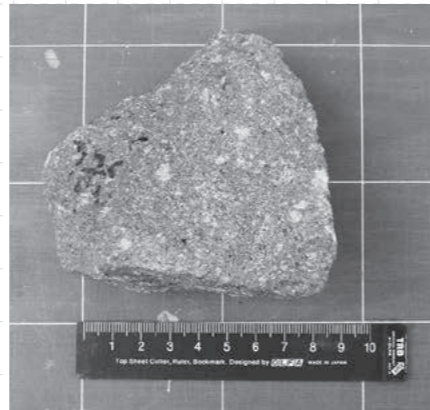
写真1 素波里安山岩

日本にもアンデサイトによく似た岩石があり、その石にはまだ正式な名前がありませんでした。そんな時、アンデサイトについて研究論文が日本にも伝わってきました。その論文を読んだ地質学者は「あの石がアンデサイトなんだ。よし、日本でもこの名前をよぶことにしよう!」と考えました。