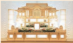
紅のホール クオールのしろ