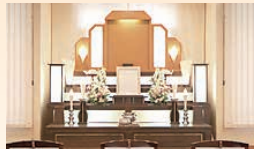
家族葬ハウス famiUar クオールのしろファミリア