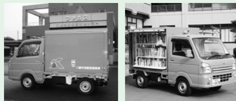
明るいオレンジ色が目印!