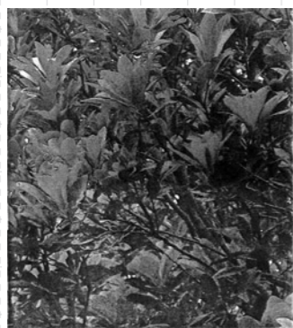
写真1. 化石の葉の形と比べてみましょう

ある地層の中にナウマンヤマモモの化石が入っていると、その地層は男鹿半島の台島にみられる地層と同じ年代にできた地層であると考えられます。実は台島にみられる地層の中にはナウマン・ヤマモモの他にも植物化石が発見されていてこれら化石を作っている植物は主として暖帯・亜熱帯に生えるものばかりなのです。このような植物群を「暖帯植物群」と呼んでいます。当時の気候は現在よりも暖かかったろうと想像することが出来ます。これら植物群をよく調べてみると、現在日本にはもう生えていない植物も含まれているそうです。この事からも、日本は大昔、今よりかなり暖かかった時代があったのです。今から二千万年ほど前の話です。