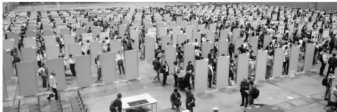
写真1:ポスター発表会場の様子

白神山地の一部が世界遺産としてユネスコで認定されてから、はや23年の歳月が過ぎました。それ以来、八峰町では各分野で世界遺産を守るための活動をしています。最近ではジオパークとしての地形・地質を含めた活動が加えられ、白神山地と海に抱かれた「八峰白神ジオパーク」を日本ジオパークに申請したところ、4年前に正式に認定されました。この事についてはすでにお知らせした通りです。 八峰白神ジオパークまでの道のり さて、去る5月22日から26日まで、千葉県にある幕張メッセで開催された日本地球惑星科学連合2016年大会で、本ジオパークはポスター発表を行いました。発表部門名は「ジオパークへ行こう」で、この部門には全国から47作品が発表されました。その中の一つとして、本ジオパークのポスター「白神山地世界遺産からジオパークへの道のり」を発表してきました。 前提活動の紹介 これまでの当ジオパーク活動を省みると無から突然で上がった