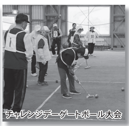
チャレンジデーゲートボール大会