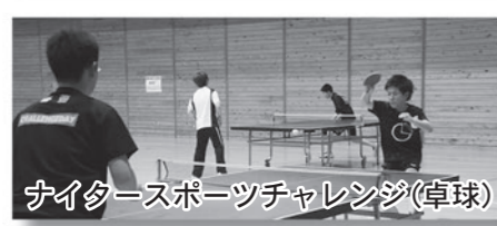
ナイタースポーツチャレンジ(卓球)

5月25日、全国128の自治体が参加するスポーツイベント「チャレンジデー2016」が開催されました。今年で3回目の参加となる八峰町は、北海道新得町と対戦し、64・6%の参加率で2年連続金メダルを獲得するとともに、見事勝利を飾りました。