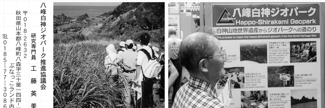
写真3:山地と海の関わりを研修する

ものではなく、すでにジオパークの理念に通じた活動が行われてきました。 青秋林道建設中止の後、自然志向が人々の間に広まり、それが世界遺産認定へとつながっていきました。続いて地域在住の人々が中心となり遺産地域を守るために遺産地域周辺にブナの森を再生する活動が始まりました。これがNP O法人白神ネイチャー協会です。 また、一般の方々に白神山地の自然の素晴らしさを理解していただくために八峰町白神ガイドの会が設立され、訪れる人々に白神山地の素晴らしさを伝える活動を行っています。 このガイドの資格を得るためには所定の講座を受けなければなりません。講座の中には動物・植物のほか地形・地質の内容が既に含まれていたのです。 つまり、白神山地の自然をまるごと学習していたことになっていたので、このことは、ジオパークの理念に合致していたのです。 このような経過を本大会で発表してきました。