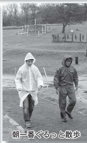
朝一番ぐるっと散歩