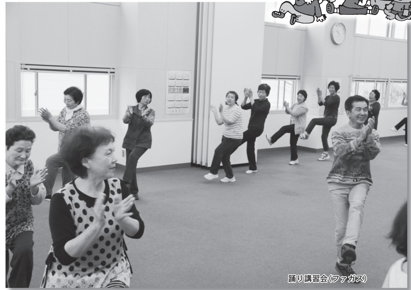
踊り講習会(ファガス)