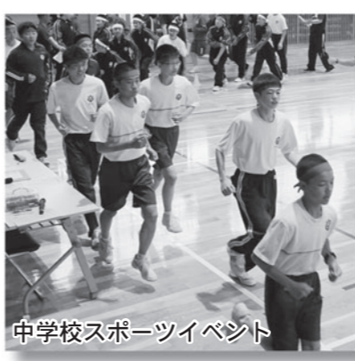
中学校スポーツイベント