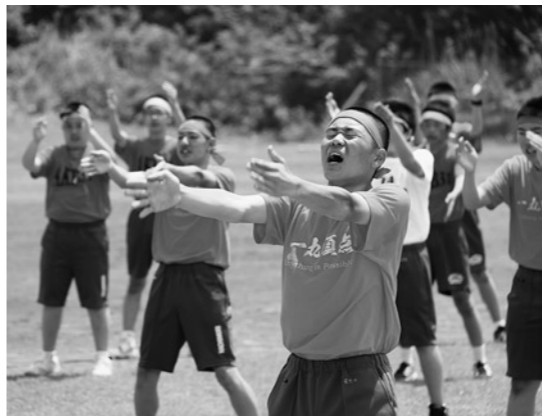
全力で会場を盛り上げた応援合戦

5月15日、22日、29日、八森小学校、峰浜小学校、八峰中学校の各グラウンドで運動会が行われました。このうち、統合して初めての運動会が行われた八峰中では、各学年2クラスずつの6チームに分かれて優勝を目指しました。きれいに足を揃えての入場行進や、上体を大きく反らしての校歌熱唱など、これが新しい八峰中生の姿だと言わんばかりの素晴らしいパフォーマンスを披露しました。 また、「飛翔く新たな伝説を創つて」というテーマを掲げ、100m走や応援合戦、駅伝、綱引き、長なわとびなどに全力で取り組む姿に、訪れた来賓や家族、地域の方から大きな声援が送られました。