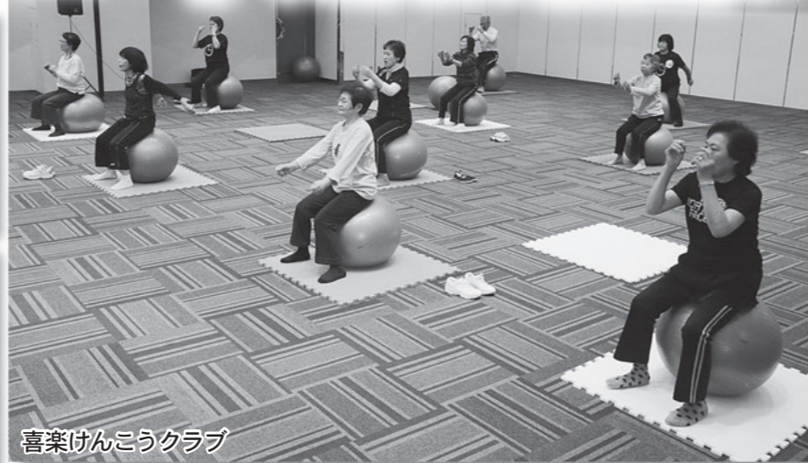
喜楽けんこうクラブ