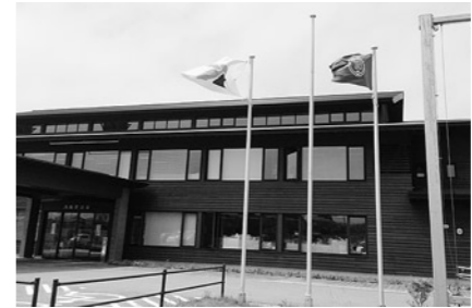
健闘を讃え、新得町の町旗を掲げました