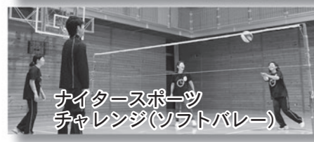
ナイタースポーツ チャレンジ(ソフトバレー)