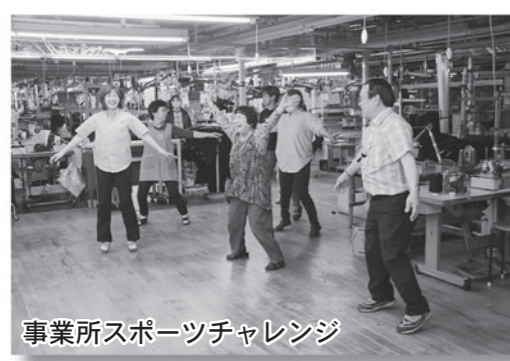
事業所スポーツチャレンジ

は昨年の参加率を超える、「参加率70%」を目標に様々なイベントを用意して取り組みました。当日は雨が降るあいにくの天気の中で行われたため、参加率は昨年より若干下がりました。しかし、小中学校や自治会、町内企業などが積極的に運動を行ったおかげで金メダル(参加率61%以上)を獲得できました。ありがとうございます。今回勝利したことで、新得町役場のメインポールには八峰町の旗が掲揚されました。八峰町役場でも新得町の旗を掲揚し、お互いの健闘を称えました。