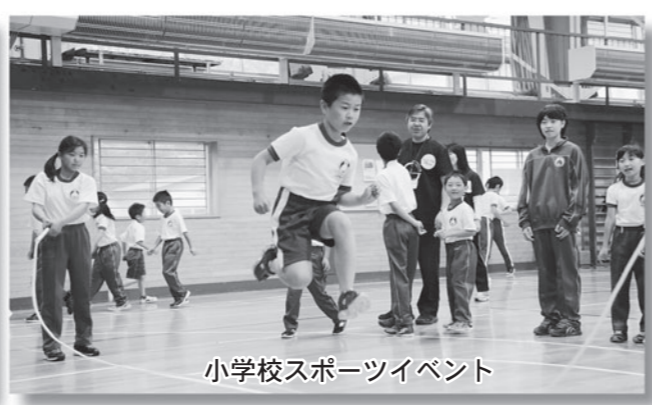
小学校スポーツイベント