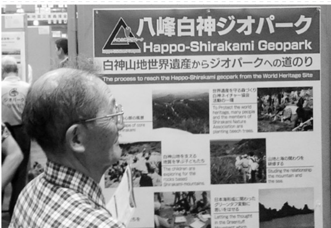
写真2:発表したポスター