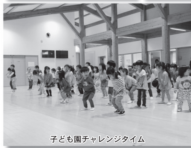
子ども園チャレンジタイム