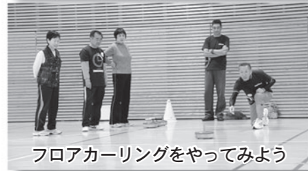
フロアカーリングをやってみよう