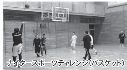
ナイタースポーツチャレンジ(バスケット)