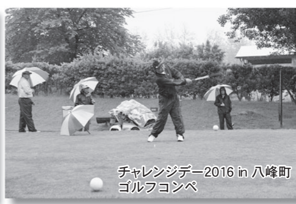
チャレンジデー2016 in 八峰町 ゴルフコンペ