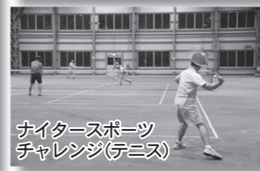
ナイタースポーツ チャレンジ(テニス)