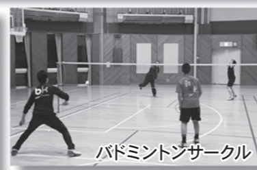
バドミントンサークル