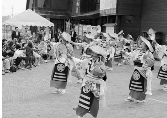
ポンポコ山さ恋、来いを盛り上げた茂浦民謡同好会

5月4日、「ポンポコ山さ恋、来い」が、道の駅みねはまや産直施設おらほの館などで初めて開催されました。ポンポコ山エリアの団体が主催したこのイベントは、エリアの活性化を目的として今後隔月で開催する予定です。初めての開催となったこの日は午前中、雨が降ったものの午後には回復。茂浦民謡同好会が花笠音頭やおこさ節など10曲を披露し、買い物に訪れた観光客など約60名を楽しませました。来場者からは手拍子や拍手が送られ、大盛況でした。 また、「売りたいもの市」も同時開催し、ドライフルーツの販売が行われました。