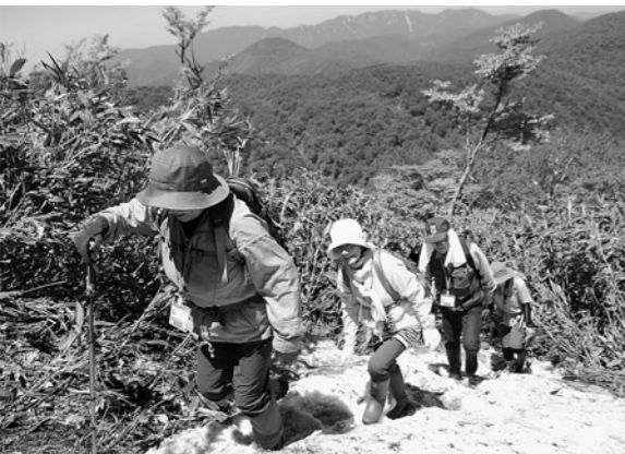
新緑のニツ森を楽しみました

5月28日、ニツ森が山開きとなり、自然観察会「ミネザクラを見よう」が、今年も開催されました。 この日はぶなっこだらけで安全祈願祭と山開きの式典を行ってから、県内外から集まった登山愛好者約20名が山頂を目指しました。 今年のミネザクラは見ごろのピークを過ぎていたものの、ところどころ咲いているのを見つけた参加者は写真を撮るなどして楽しみました。 また、この時期に咲いているのは珍しい「イワウチワ」を目にすることもできました。 例年より少ない残雪を踏みしめたどり着いた山頂からの景色は格別でした。