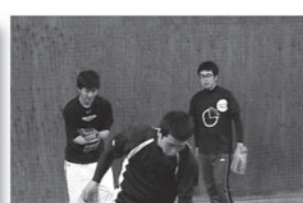
ナイタースポーツ チャレンジ(野球)