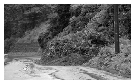
平成26年8月、ぶなっこランド手前で発生した土砂崩れ

全国で毎年平均1,000件以上発生している土砂災害。 いざという時のために、避難場所、避難経路を確認し、自分の身は自分で守りましょう。 〈ポイント〉 ・日頃から住んでいる地域の危険度を把握する ・雨が降り出したらテレビなどの情報に注意 ・夜間に大雨が予想されるときは暗くなる前に避難