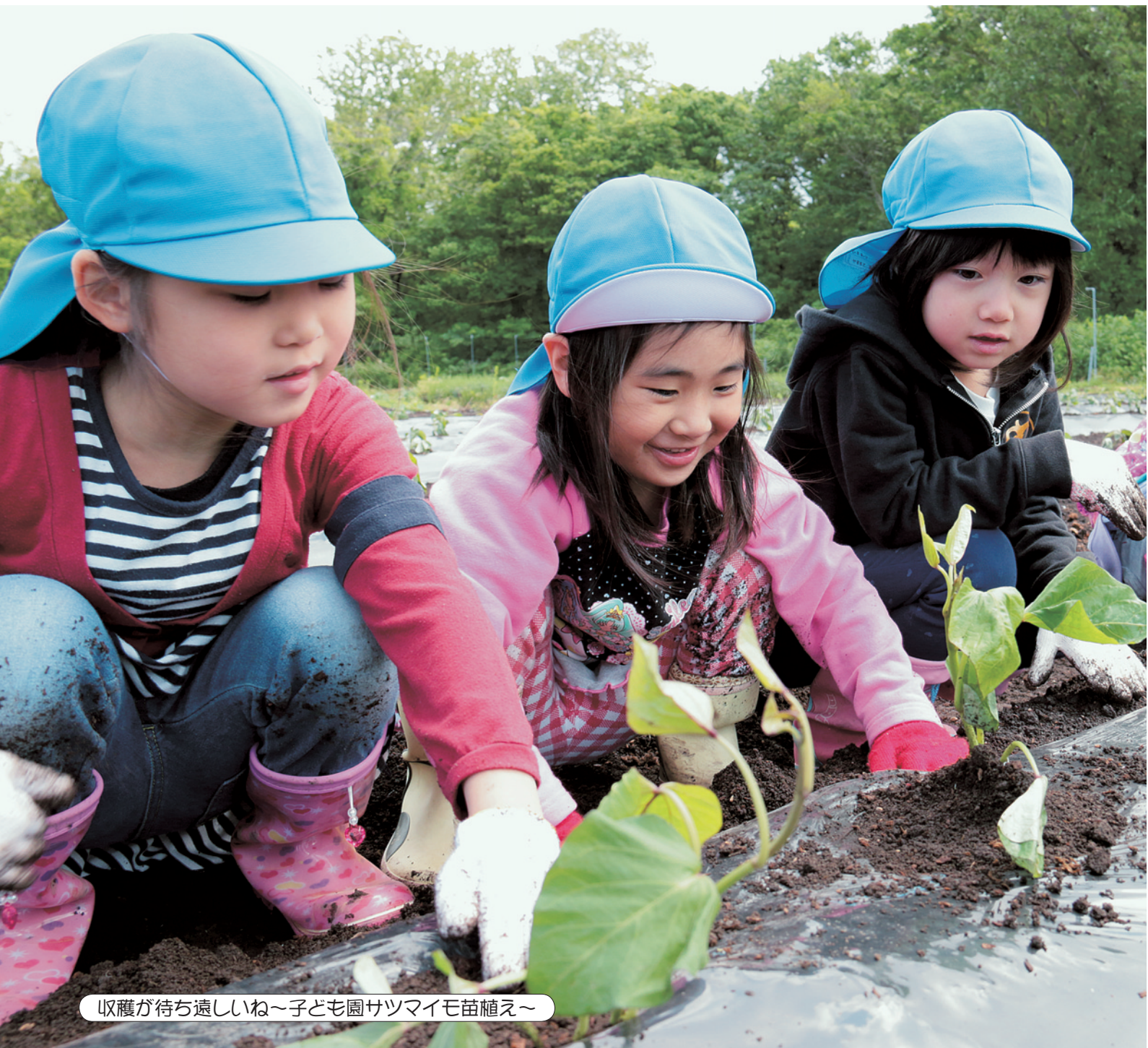
収穫が待ち遠しいね～子ども園サツマイモ苗植え～