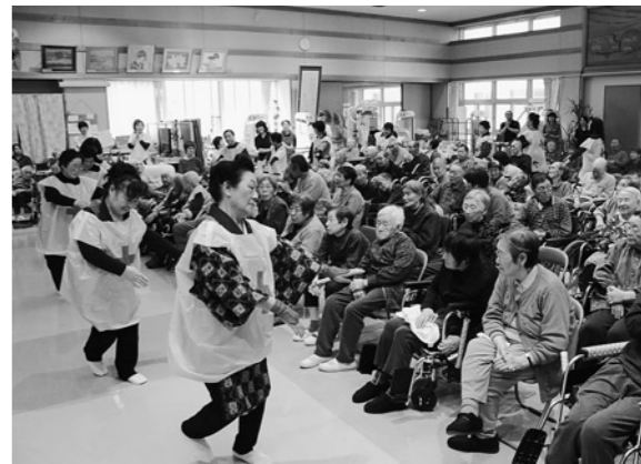
利用者を囲んで踊りを披露しました

3月7日、日赤奉仕団峰浜支部が特養松波苑を訪れ、手づくりのタオル帽子などを贈呈したほか、演芸交流会を行いました。