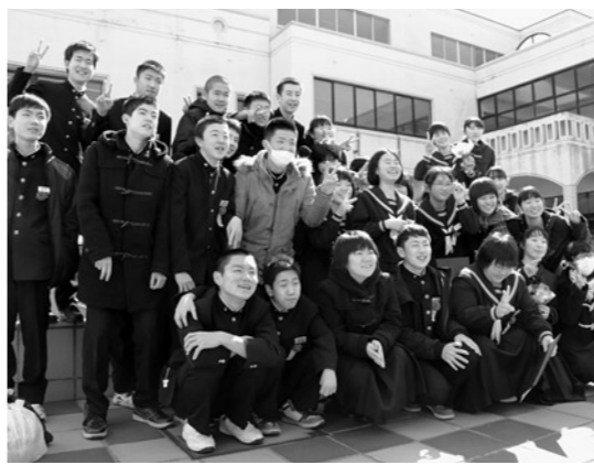
青空の下で卒業を喜び合いました

3月12日は八森・峰浜中学校で、同日は八森・水沢・埴川小学校で、同日は八森・沢目・埴川子ども園において、それぞれ卒業式と卒園式が行われました。 このうち、八森中学校と峰浜中学校、水沢小学校と埴川小学校は統合するため、最後の卒業式となりました。八森中学校では卒業生に対し、校長先生や町長などから、八中の校訓「自主創造」、校是「海広く心豊かなり」の精神を忘れず未来へ向かってほしいと励ましの言葉が贈られました。