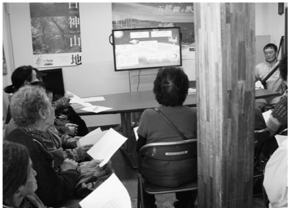
食事に買い物に歌と充実した1日を過ごしました

3月14日、産直施設おらほの館で、一人暮らし高齢者を対象に「お食事・お買い物体験会」が開催されました。おらほの館産直部の主催で毎年実施しており、今年で5年目。一人暮らし高齢者へ通知をしたところ、23名が参加しました。