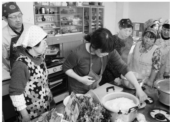
普段と一味違ったあわび料理を作りました

石川先生からは「生春巻きを作るときは少し細めに、あわびが外から見えるように巻くときれいにできます」といったアドバイスもあり、参加者は上手に巻けるよう調理しました。