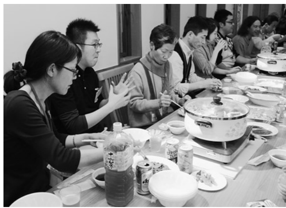
鍋を囲んで会話が盛り上がりました

移住者交流会では、ツアー参加者のほか、移住や定住に興味のある町民や移住の先輩など約40名が集まりました。参加者は自分たちで作ったきりたんぽ鍋を囲み、移住や町のことについて理解を深めました。