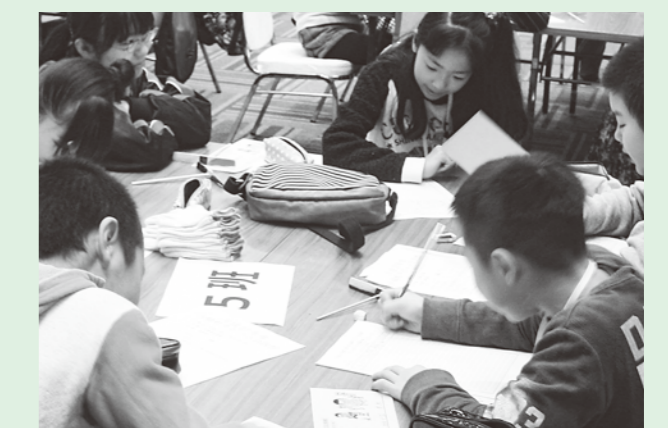
将来の自分を想像しながら手紙を書きました

り、子ども達は20歳の自分に向けた手紙を書きました。この手紙はタイムカプセルとして保管され、成人式で本人に手渡される予定です。また、生涯学習奨励員や中学生ボランティアの皆さんと一緒に竹とんぼづくりや餅つき、レクリエーションも行い、にぎやかな一日を過ごしました。