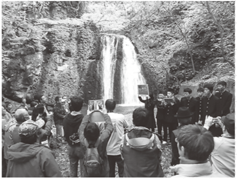
白瀑神社を案内する能代高校生たち。

このツアーは、1泊2日で八峰町と青森県深浦町の見どころを巡りました。地すべりによって形成された十二湖や秋田県天然記念物に指定された榎海岸の柱状節理、そして地形が信仰に関わる白瀑神社を巡るツアーです。宿泊したあきた白神温泉ホテルでは交流会を開催し、茂浦民謡同好会による伝統芸能を披露しました。このツアーは白神山地の形成と、その大地で生活する人びとの暮らしを体感できるのが特徴です。 また、白瀑神社では能代高校の科学部の生徒がガイドを務め、自分たちで調べた情報をもとに参加者を案内しました。