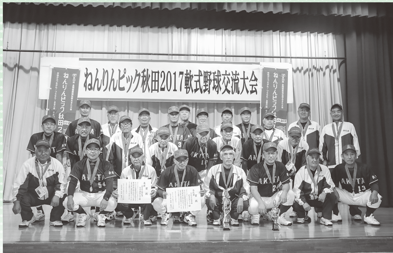
白河楽翁クラブ、秋田選球クラブ合同の集合写真