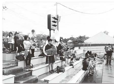
高校野球でおなじみの曲も

9月9日から12日にかけて、秋田県内(17市町村)で第30回全国健康福祉祭あきた大会「ねんりんピック秋田2017」が開催されました。 全国健康福祉祭は、60歳以上の方を中心とした健康と福祉の総合的な祭典です。厚生省(現在の厚生労働省)設立50周年を記念して、昭和63年に兵庫県で開催されて以来、毎年開催されています。 八峰町では、能代市、藤里町とともに9月10日から12日の日程で軟式野球交流大会が開催され、八峰町峰浜野球場では秋田県代表を含めた全国から6チーム総勢90名が集まり、熱戦を繰り広げました。 来場した皆さんの健康を願い、八峰町愛育班や秋田しらかみ看護学院の学生さんによる健康づくり教室が開催されました。また、白神八峰商会女性部によるドリンクコーナー、八峰町観光協会による地元特産品販売が行われたほか、おもてなしコーナーでは10日に「石川そば」、11日に「つみれ汁」がふるまわれ、選手の皆さんは舌鼓を打っていました。 日曜日には能代高校吹奏楽