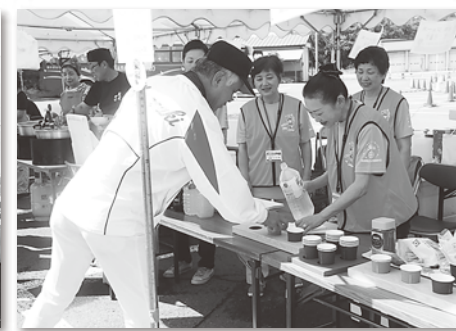
商工会のドリンクコーナー