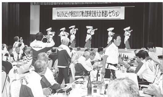
カメラで撮影する姿も

部と、地元のプラスバンド愛好家の皆さんがスタンドで応援曲を披露しました。ある選手の方は、「普段の試合では、演奏付きで応援されることがないので嬉しい」と喜んでいました。 10日の歓迎会では、地元PRを兼ねて、地魚・地元食材を用いた料理の数々や地酒とともに、マグロの解体ショーや茂浦民謡同好会による舞踊を堪能するなど、大いに盛り上がっていました。 最終日の12日は残念ながら雨天により決勝戦は行われませんでした。抽選により福島県代表の白河楽翁クラブが優勝しました。表彰式の後、準優勝となった秋田県代表の