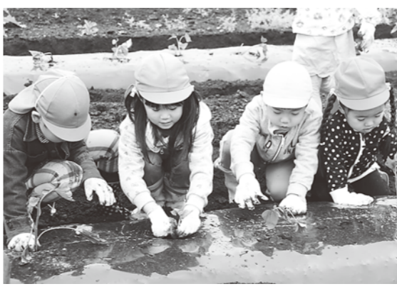
秋の収穫が楽しみです

6月5日、6日、田中地区のふれあい農園で町内の子ども園の園児たちがサツマイモの苗植えを体験しました。 このうち、塙川子ども園の園児たち10名は、役場の担当者から苗の植え方の説明を受けた後、一列に並んで苗を植え始めました。苗植え体験の間、自分の植えた苗を指さして「これでいいの?」と尋ねたり、真っ黒になった軍手を面白そうに先生に見せたりする園児たちの姿が見られました。 最後に並んで記念写真を撮した後、土で汚れた長靴をきれいに洗って苗植え体験は終了しました。秋の収穫が楽しみです。