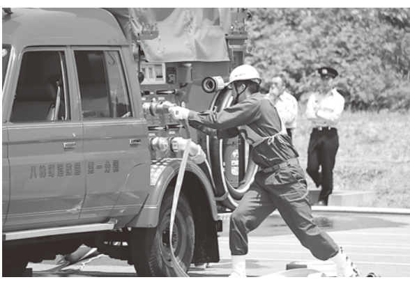
機敏な動きは訓練のためもの

6月18日、平成29年度八峰町消防操法大会が役場駐車場で行われ、参加した町内の全15分団が、日頃の操法訓練の成果を披露しました。 競技は、小型ポンプの部とポンプ車の部の2つの部で行われ、各分団は前方にある的を倒すまでのタイムや動作の正確さを競いました。 ■大会の結果 ○小型ポンプの部 優勝：第5分団(石川) 準優勝：第10分団(浜田・本館) 第3位：第3分団(田中・沼田) 第4位：第15分団(小入川・岩館) ポンプ車の部 優勝：第1分団(水沢)