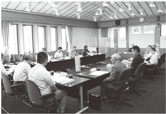
本番に向けて大会運営等を確認しました

6月20日、八峰町役場でねりんピック秋田2017八峰町実行委員会が開催されました。 「ねりんピック(正式名称…全国健康福祉祭)」は、スポーツや文化種目の交流大会などのイベントを通じて、ふれあいと活力ある長寿社会の形成を目指すという催しです。昭和63年から毎年開催されており、9月9日からの第30回秋田大会では、八峰町・能代市・藤里町で軟式野球が共催されます。 実行委員会では大会に向けて日程や分担を確認したほか、参加者への記念品などについて話し合いが行われました。