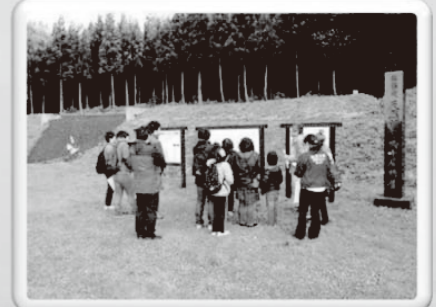
昨年度の野外観察の様子（美郷町）