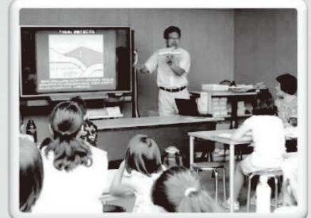
昨年度の講義の様子

秋田県の地震災害について調査・研究している大学の先生から、過去に起こった地震や津波のことを学び、きみの命を守る防災力をアップさせよう！今回は八峰町にて開催します！過去に起こった地震や津波の痕跡（こんせき）などをバスで巡りながら、見所をわかりやすく解説するよ！